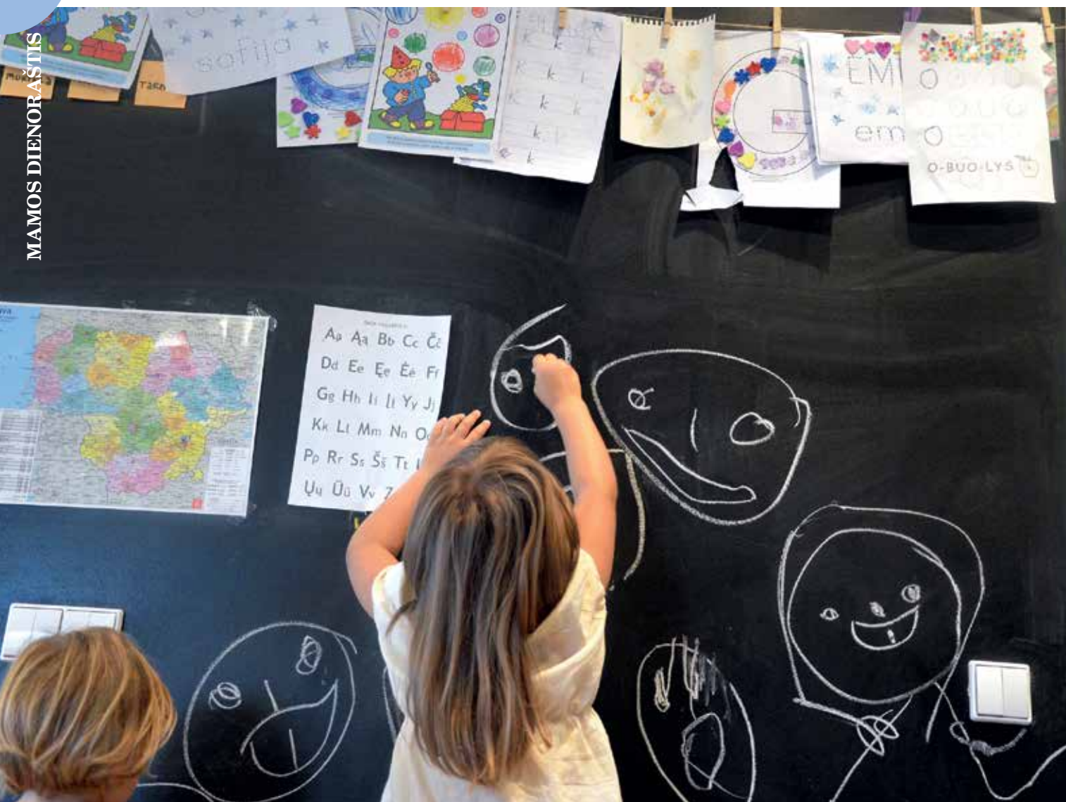
EGLĖS RACEVIČIŪTĖS TEKSTAS.